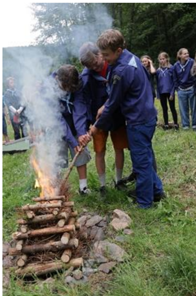
Kormidelníci zapalují táborák