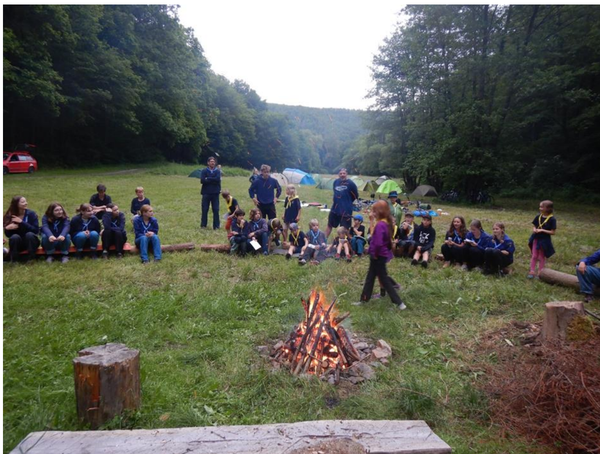
Pišišvoři a jejich vystoupení