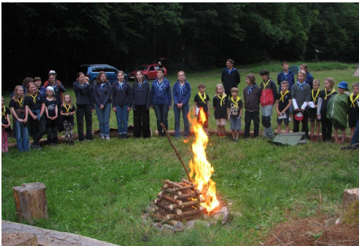
Červená se line záře