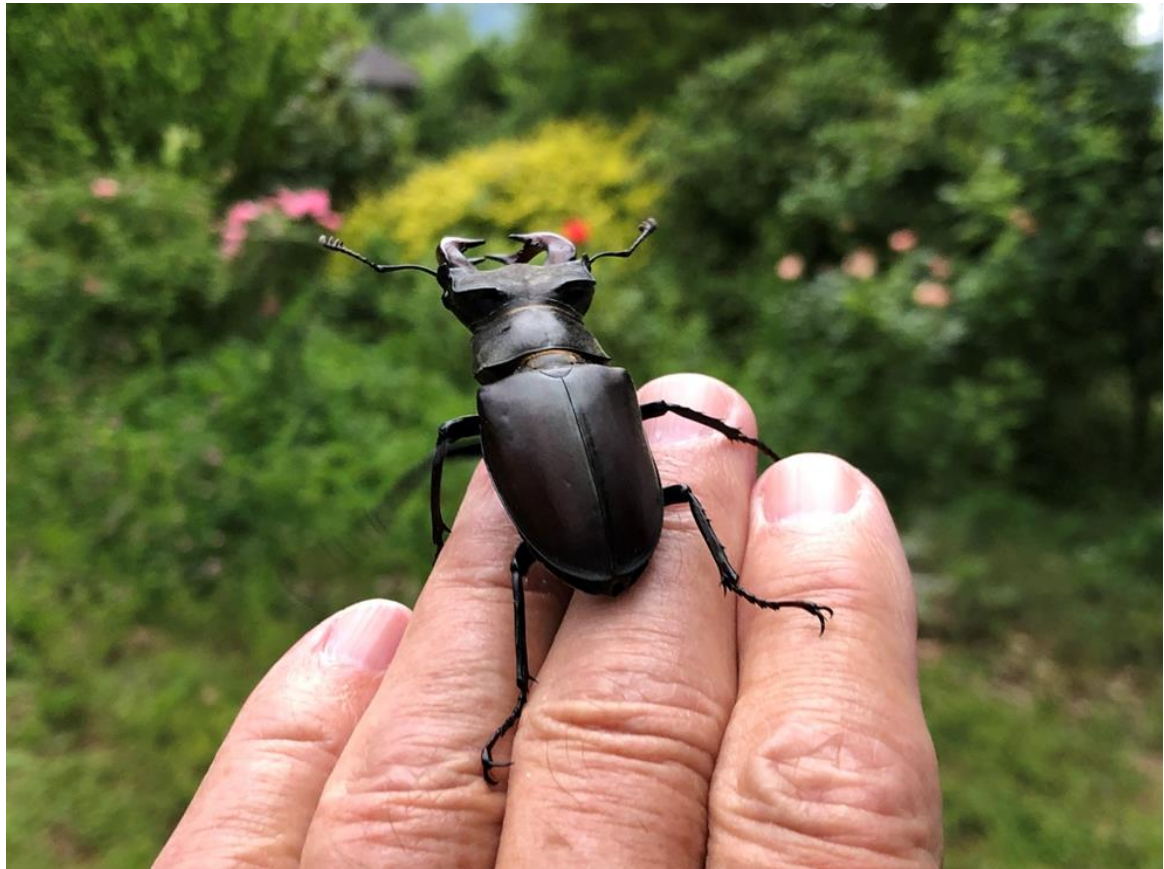
Jeden z účastníků schůzky