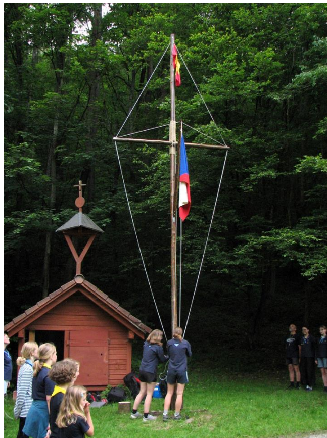
Vlajka vzhůru letí