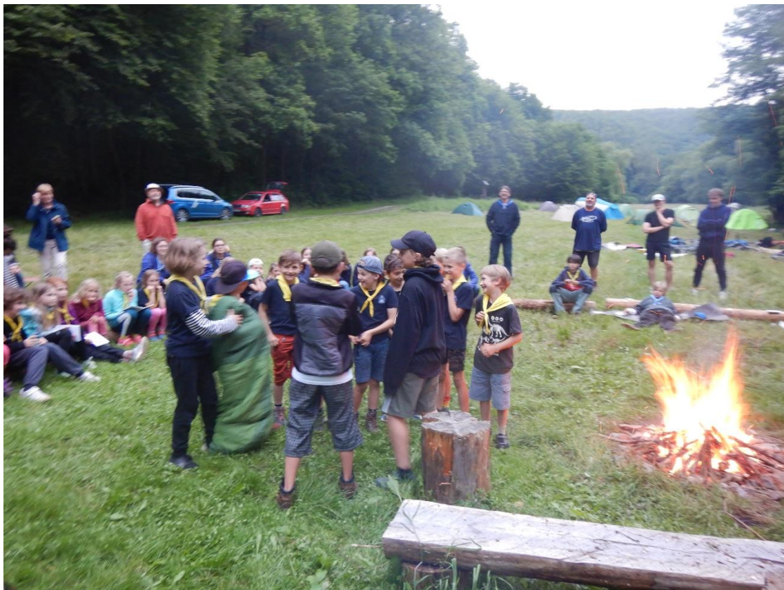
Sluníčka a jejich vystoupení