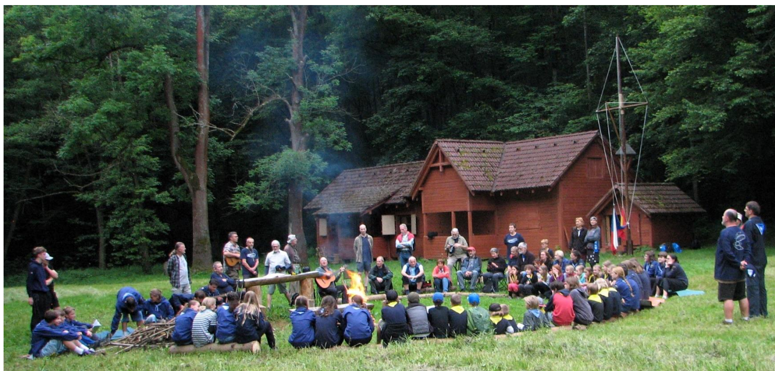
Celkový pohled na táborák a všechny účastníky