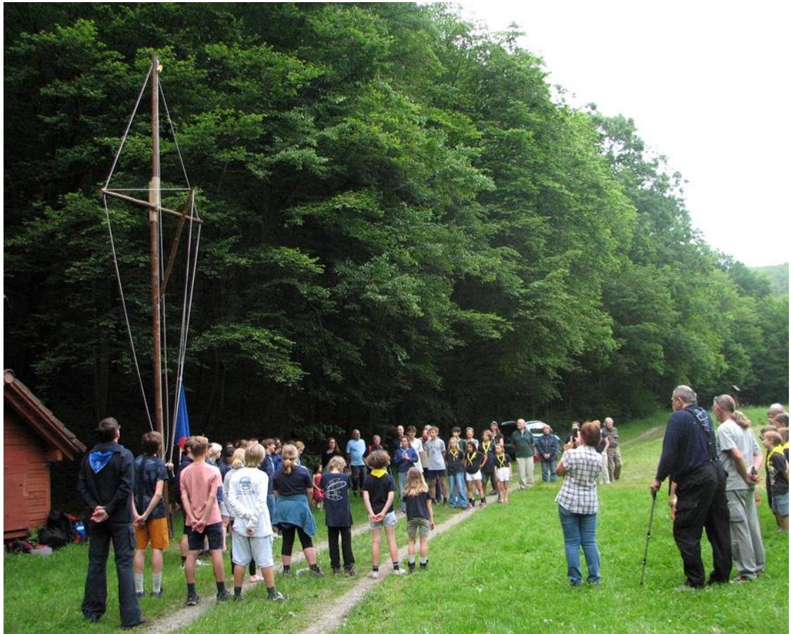
Nástup u stožáru